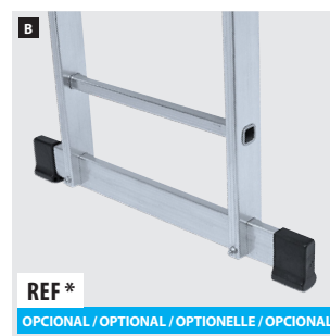
A Gancho de aluminio. Aluminium hook. Crochet en aluminium. Gancho de aluminio. B Base estabilizadora. Stabilizer base. Base stabilisatrice. Base estabilizadora.