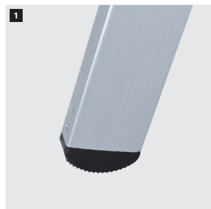
1 Tapafinal de PVC con relieves antideslizantes. PVC end cap with anti-slip reliefs. Patin en PVC avec reliefs antidérapants. Pé de PVC com relevos antiderrapantes.

✂ Productos suministrados parcialmente desmontados. Products supplied partially disassembled. Produits fournis partiellement démontés. Produtos fornecidos parcialmente desmontados.