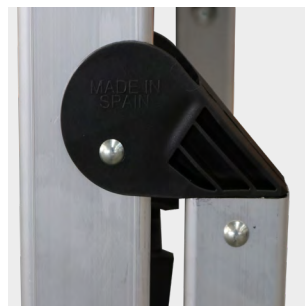
Bisagras de PP PP hinges Charnières en PP Dobradiça PP