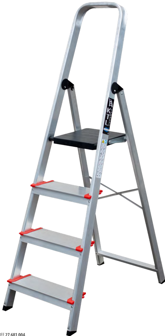
REF 27 681 004

ES Plataforma de PP de 25x25 cm con sistema de bloqueo exclusivo.