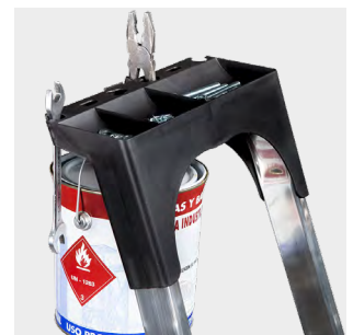
Bandeja para herramientas Tray for tools Porte-outils Bandeja de ferramentas