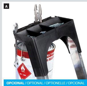
OPCIONAL / OPTIONAL / OPTIONELLE / OPCIONAL