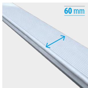
Peldaño ancho de 60 mm con relieves antideslizantes Wide rung of 60 mm with anti-slip reliefs Échelon large de 60 mm avec des reliefs antidérapants Degrau grande de 60 mm com relevos antiderrapantes