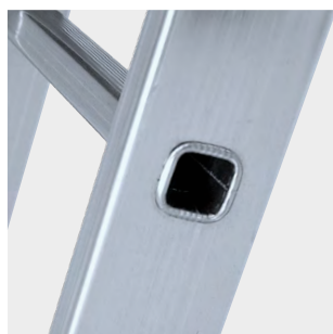
Peldaños engastados con relieves antideslizantes Rungs set with anti-slip reliefs Échelons serties avec des reliefs antidérapants Degraus inseridos com relevos antiderrapantes

Productos suministrados parcialmente desmontados. Products supplied partially disassembled. Produits fournis partiellement démontés. Produtos fornecidos parcialmente desmontados.