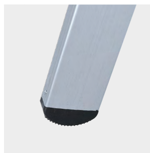
Tapafinal de SBS con relieves antideslizantes SBS end cap with anti-slip reliefs Patin en SBS avec reliefs antidérapants Pé de SBS com relevos antiderrapantes