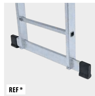
Base estabilizadora Stabiliser bar Barre stabilisatrice Base estabilizadora